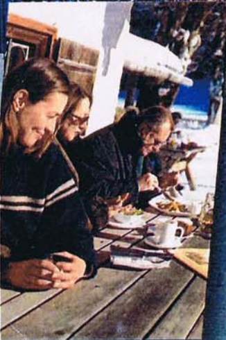
Standhaft: Der Schweinebraten des Nachbarn kann die Fastenwanderer gar nicht reizen